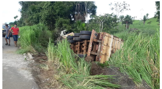
Caminhão tentou desviar de acidente na BR-364 em Presidente Médici, RO, mas acabou tombando.

Outro caminhão que trafegava no sentido oposto tentou desviar, para não bater no caminhão que já estava atravessado na pista, mas também acabou tombando. Ninguém ficou ferido.